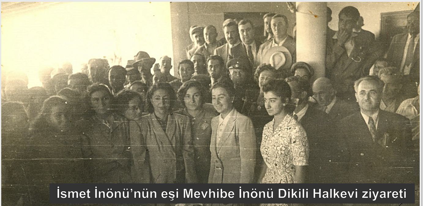
İsmet İnönü'nün eşi Mevhibe İnönü Dikili Halkevi ziyareti

önemli bir konumdadır. Gerek bulunduğu konum, gerekse simge olmuş bu bina yazımızın başında bahsettiğimiz kent kimliğinin önemli unsurlarından biridir.