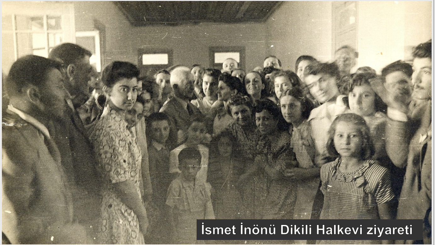
İsmet İnönü Dikili Halkevi ziyareti

2009 yılında Dikili Devlet Hastanesi açılana kadar Acil Servisi ile poliklinikleri ile o tarihe kadar Dikili'nin tek sağlık kurumu olan tarihi binada hizmet veren Dikili 1 nolu Sağlık Merkezi günümüzde de