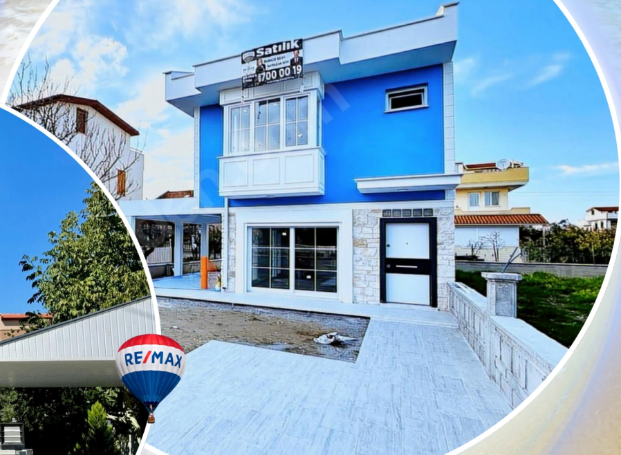
Dikili ve Salihlerlatı'nda